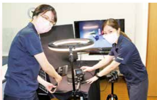
機材、ソフトへの投資は20万円程度

個性ある社員たちが、それぞれ輝くサイマコーポレーション。頭の高さわずか0.5mmの超極低頭ねじに「最低なねじ」とキャッチコピーと付ける余裕など、当社に仕事を楽しい空気感に満ちている。その一番のムードメーカーが、齋間社長であることは間違いない!